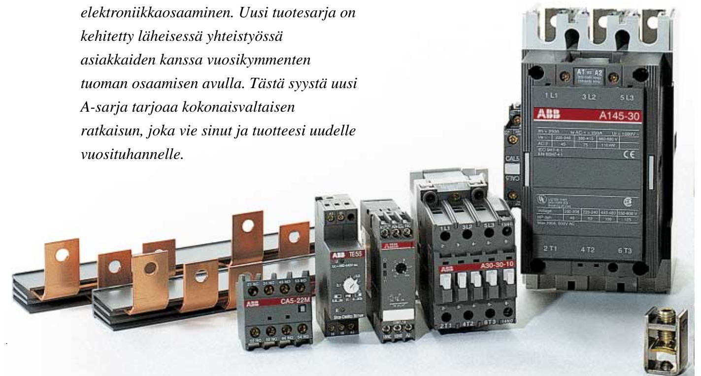
ABB:n uusi moottorinohjaukseen ja -suojaukseen tarkoitettu komponenttisarja perustuu uusiin A-sarjan kontaktoreihin. A-sarjan kontaktorit edustavat suunnittelun ja muotoilun uusinta ajattelua, joissa yhdistyvät uusin materiaali- sekä elektroniikkaosaaminen. Uusi tuotesarja on kehitetty läheisessä yhteistyössä asiakkaiden kanssa vuosikymmenten tuoman osaamisen avulla. Tästä syystä uusi A-sarja tarjoaa kokonaisvaltaisen ratkaisun, joka vie sinut ja tuotteesi uudelle vuosituhannelle.

Halutun yhdistelmän luomiseen tarvitaan nyt entistä vähemmän komponentteja.