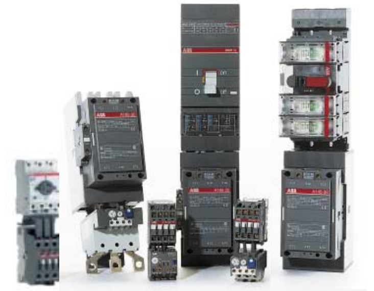
ABB tarjoaa asiakkailleen kokonaisvaltaisia ratkaisuja pitkälle kehitettyjen kansainvälistä tunnustusta saaneiden tuotteiden ja palvelujen avulla. Yli sadan vuoden kokemus sähkötekniikasta on hionut toimintamallimme huippuunsa. Toimimme maailmanlaajuisesti yli sadassa maassa. Kaikkien tuotteidemme lähtökohdaksi on laaja tutkimustyö, jatkuva testaaminen ja laaduntarkkailu sekä tuotteidemme täydellinen dokumentointi.

A-sarjan kontaktorit - suunniteltu viemään sinut ja tuotteesi uudelle vuosituhannele: